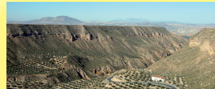
Deslizamientos rotacionales típicos de sedimentos con abundancia de gravas