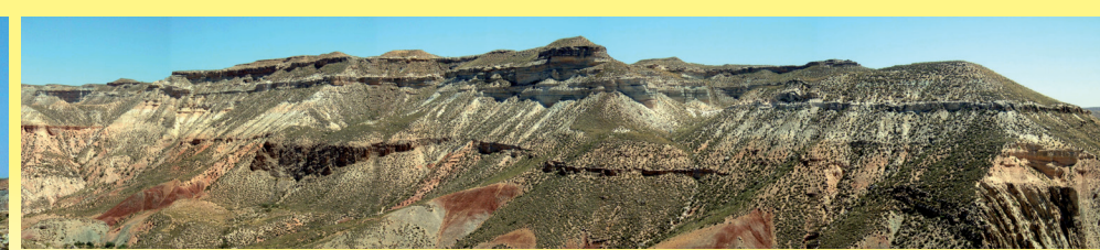
Discordancia entre los materiales horizontales de relleno de la cuenca (parte superior) y el basamento plegado (parte inferior)