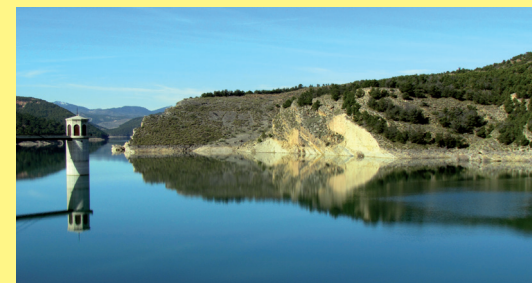
Estratos inclinados de la etapa marina de la cuenca