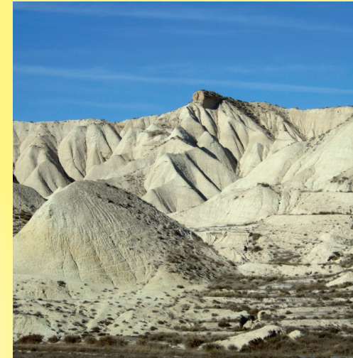
Relieve en cárcavas típico de sedimentos arcillosos