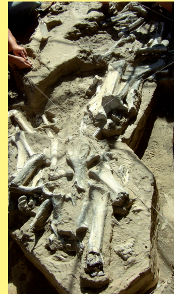
Acumulación de huesos de grandes vertebrados en el yacimiento paleontológico de Fonelas