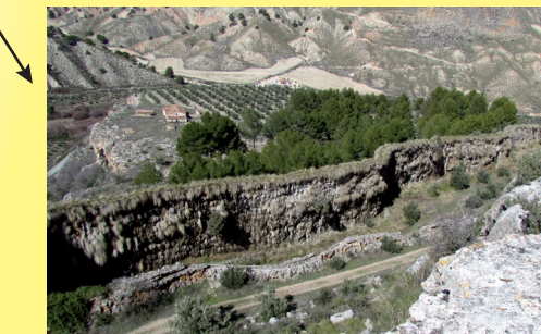
Canal construido por precipitación de carbonato a partir de aguas termales